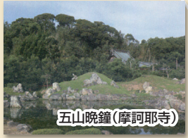
五山晩鐘(摩訶耶寺)

館山寺温泉観光協会発→館山寺「館山秋月」→細江町浙江省友好記念公園「細江帰帆」→浜名湖SA・湖上遊覧船「寸座落雁」→佐久米→瀬戸「瀬戸夜雨」→瀬戸港→競艇場→浜名湖ガーデンパーク→館山寺温泉観光協会着 ※浜名湖遊覧船瀬戸港から浜名湖遊覧船で出発地まで戻る事が出来ます。(乗船代が別途かかります)