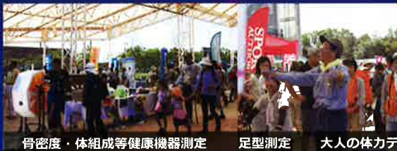
骨密度・体組成等健康機器測定