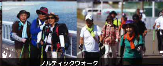
ノルディックウォーク