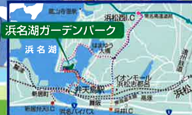
浜名湖ガーデンパーク