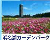
浜名湖ガーデンパーク